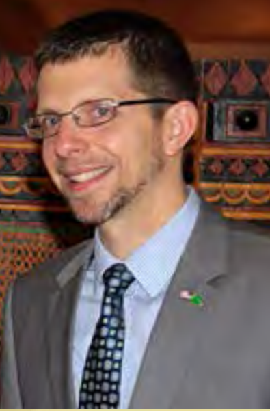
السيد/ مايك هانكي

إن أحد أهدافنا الأكثر أهمية في القنصلية الأمريكية بالظهران هو العمل في شراكة مع الشعب السعودي وتعزيز الرخاء المشترك في قلب المنطقة الشرقية بالمملكة، ويعد تشجيع نمو وتنمية القطاع الصحي السعودي عنصراً رئيسياً لدينا لزيادة الازدهار، حيث أن جلب السعوديين والأمريكيين معا للنظر في التحديات الراهنة التي تواجه نظام الرعاية الصحية ومناقشة الحلول الممكنة هو السبيل الأفضل لتحقيق هذا الهدف.