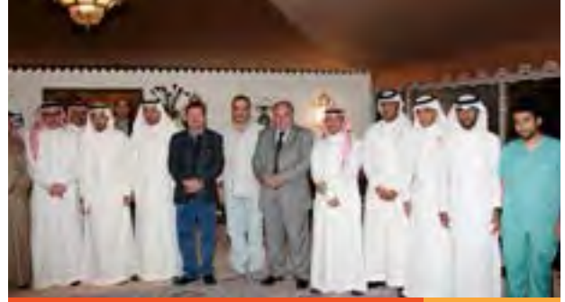
الديوانية الأولى خليجياً للتوعية وتبادل الخبرات