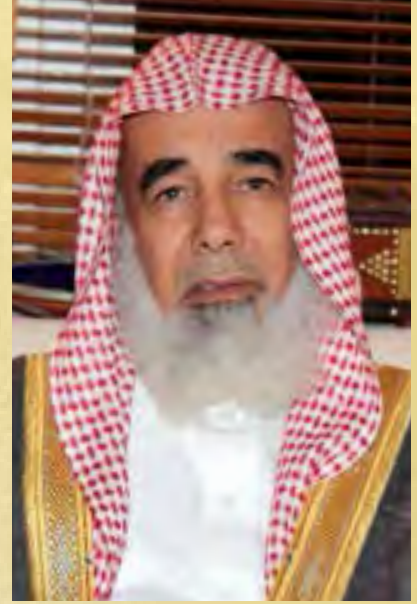
الشيخ/ خلف المطلق

فالدين الإسلامي سبق الأديان الأخرى في كل شيء حيث دخلت امرأة النار في هرة حبستها لاهي أطعمتها ولا تركتها تأكل من خشاش الأرض، وامرأة لما رأت كلبا يأكل الثرى من العطش أنزلت موقها فسقته فشكر الله لها فغفر لها، فإذا كان ذلك عناية بالبهائم فما بالك العناية بالإنسان.