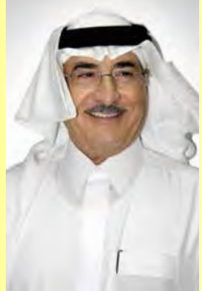
عبدالعزیز بن علی التركي مؤسس الديوانية

ختاما نتوجه بالشكر والعرفان لصاحب السمو الملكي الأمير سعود بن نايف بن عبدالعزيز أمير المنطقة الشرقية على الاهتمام الذي يوليه للمجال الطبي ودعمه المستمر لجمعيات التوعية الصحية، كما نشكر كافة الضيوف والمتحدثين الذين تشرفت الديوانية بحضورهم المثمر.