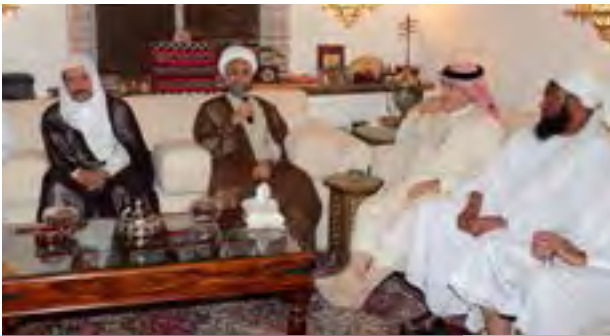
الشيخ الصفار دور منظمات المجتمع المدني